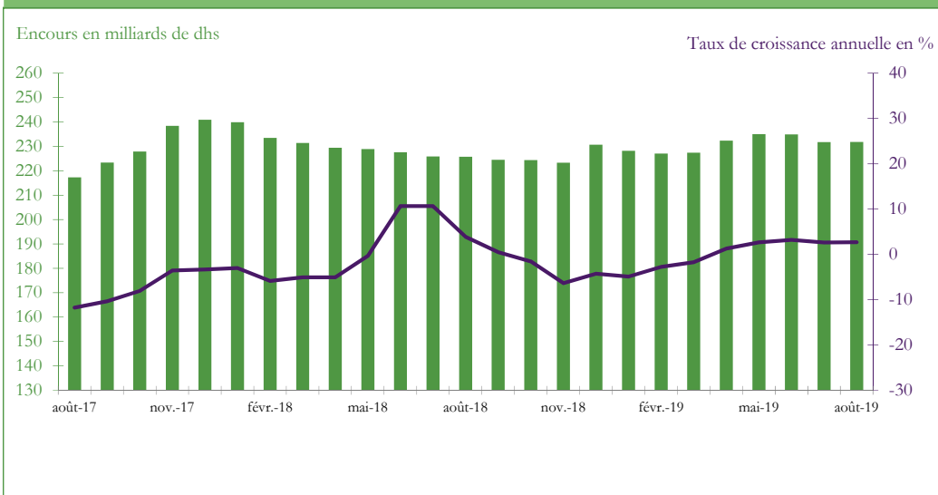
Graphique 3 : EVOLUTION DES RESERVES INTERNATIONALES NETTES